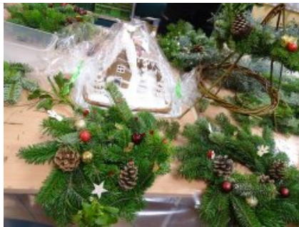
Przygotowania do świąt z dzielnicowym