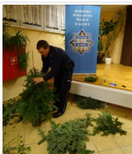
Przygotowania do świąt z dzielnicowym