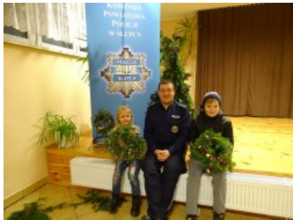
Przygotowania do świąt z dzielnicowym