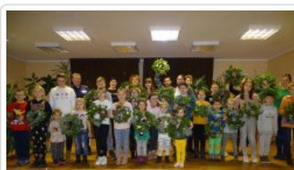
Przygotowania do świąt z dzielnicowym