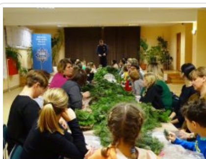
Przygotowania do świąt z dzielnicowym