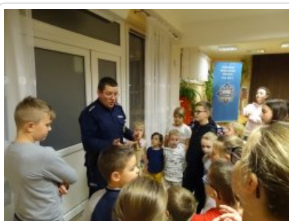
Przygotowania do świąt z dzielnicowym