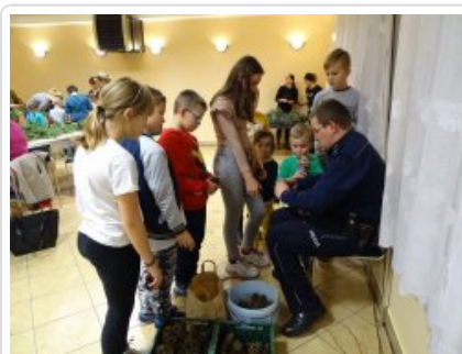
Przygotowania do świąt z dzielnicowym